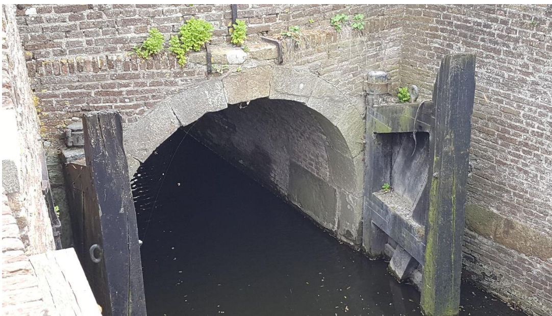
Figuur 3: Foto locatie tijdens veldbezoek op 17 april 2019.