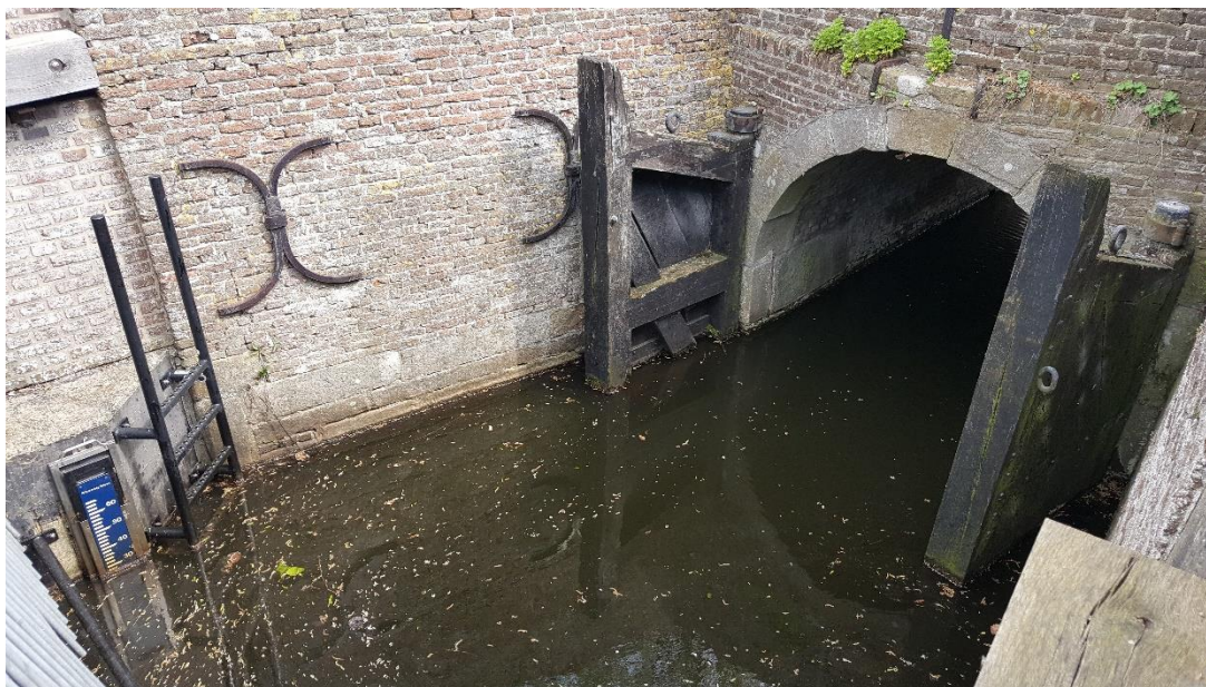
Figuur 2: Foto locatie tijdens veldbezoek op 17 april 2019.